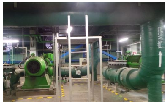
รูปที่ ค-3 การหล่อเย็นระบบหล่อเย็นแบบปิด (Closed Cycle Cooling Water System) ด้วย Absorber เพื่อลดระดับเสียง