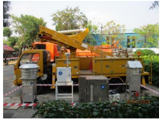
ภายในพื้นที่โครงการโรงไฟฟ้าพระนครเหนือ ชุดที่ 2

การตรวจวัดคุณภาพอากาศในบรรยากาศโดยทั่วไป และสภาพอุตุนิยมวิทยา (เมื่อวันที่ 10-17 มกราคม 2567)