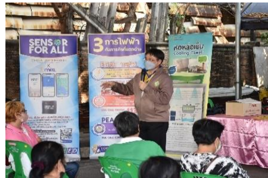
รูปที่ ค-21 กิจกรรมชุมชนสัมพันธ์สัญจรในพื้นที่รอบโรงไฟฟ้าพระนครเหนือ