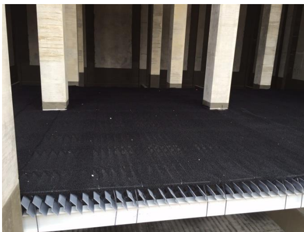
รูปที่ ค-7 การติดตั้งแผ่นดูดซับเสียงบริเวณหอหล่อเย็นของโรงไฟฟ้าพระนครเหนือ