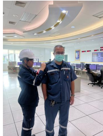
รูปที่ ค-19 การตรวจวัด Workplace Environment Monitoring Program