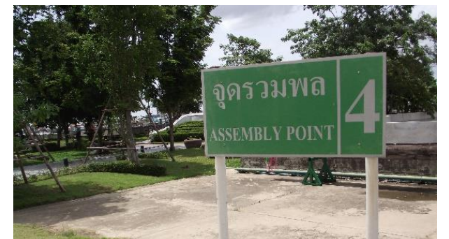
รูปที่ ค-14 จุดรวมพลภายในโรงไฟฟ้า