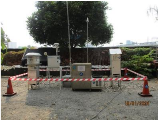
วัดสร้อยทอง