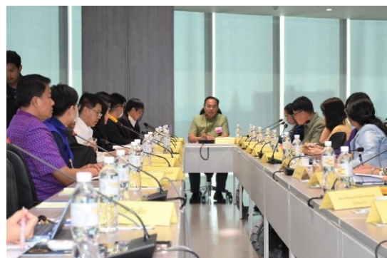
รูปที่ ค-22 ประชุมคณะทำงานสิ่งแวดล้อมฯ และคณะกรรมการร่วมติดตามตรวจสอบการดำเนินงาน และพัฒนาสิ่งแวดล้อมชุมชนโรงไฟฟ้าพระนครเหนือ