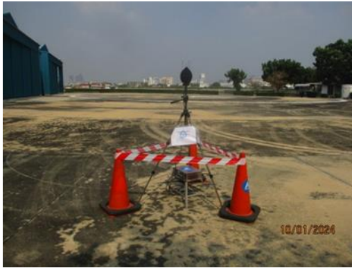
บริเวณแนวรั้วด้านทิศตะวันตกเฉียงเหนือ ของโรงไฟฟ้าพระนครเหนือ