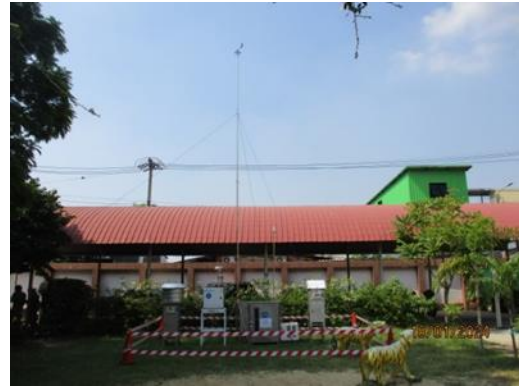
โรงเรียนกลาโหมอุทิศ