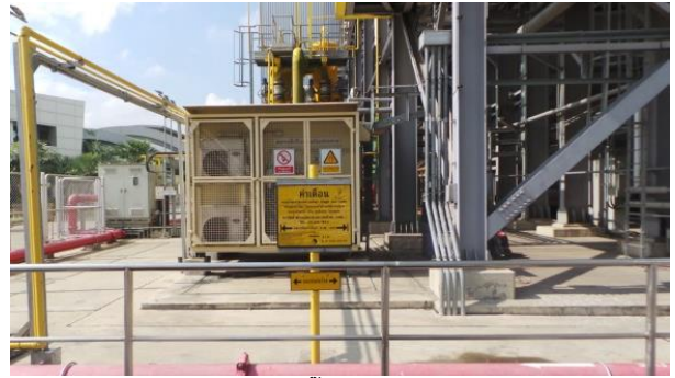
รูปที่ ค-15 การติดตั้งป้ายบอกตำแหน่งและทิศทางของท่อส่งก๊าซ