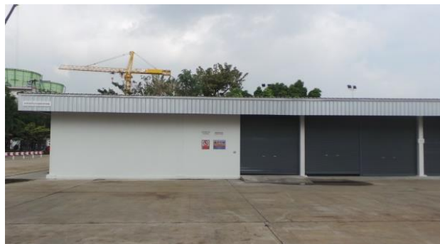
รูปที่ ค-11 สถานที่เก็บกากของเสียอันตราย