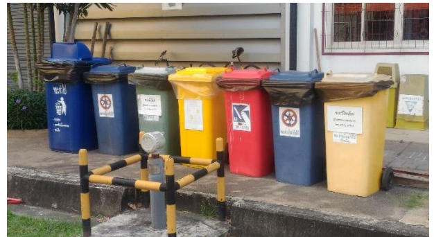
รูปที่ ค-10 ถังขยะแยกตามประเภทของขยะ