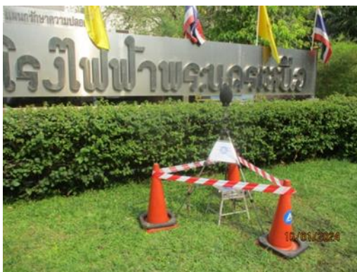
บริเวณแนวรั้วด้านทิศตะวันตกของโรงไฟฟ้าพระนครเหนือ