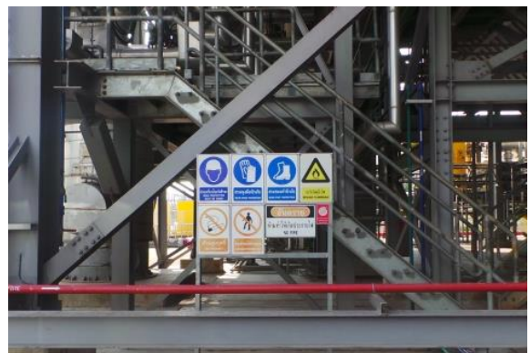
รูปที่ ค-16 การติดตั้งป้ายเตือนอันตรายให้ครอบคลุมพื้นที่ต่างๆ ในโรงไฟฟ้า