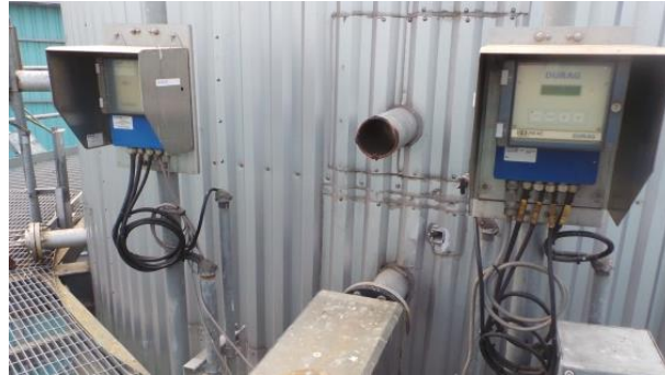
รูปที่ ค-1 ระบบการติดตามตรวจสอบการระบายมลสารต่อเนื่อง (Continuous Emission Monitoring System; CEMS)