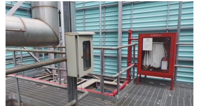
รูปที่ ค-13 การติดตั้งอุปกรณ์ดับเพลิงให้ครอบคลุมพื้นที่ต่างๆ ในโรงไฟฟ้า