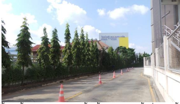
รูปที่ ค-8 โรงไฟฟ้า ได้ปลูกและดูแลรักษาต้นไม้ตามแนวเขตพื้นที่โรงไฟฟ้า อย่างสม่ำเสมอ