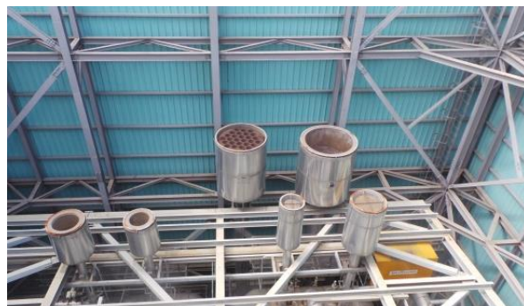
รูปที่ ค-4 การครอบเครื่องจักรด้วยวัสดุดูดซับเสียงและติดตั้งชุดลดเสียง (Silencer)