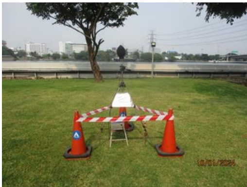
บริเวณบ้านพักพนักงาน (เดิม) ด้านทิศตะวันออกของโรงไฟฟ้าพระนครเหนือ

การตรวจวัดระดับเสียงโดยทั่วไป (เมื่อวันที่ 11-16 มกราคม 2567)