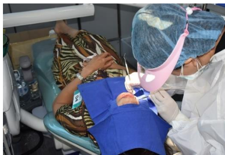
รูปที่ ค-20 การสนับสนุนบริการสาธารณสุข (ทันตกรรมเคลื่อนที่)