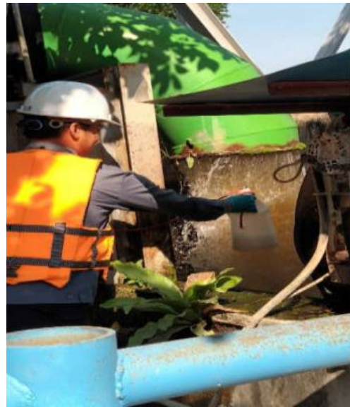
การตรวจวัดคุณภาพน้ำทิ้ง (เมื่อเดือนมกราคม 2567 และเดือนพฤษภาคม 2567)