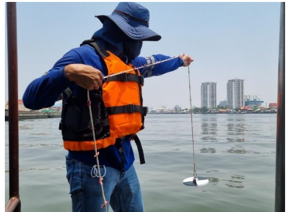
การตรวจวัดคุณภาพน้ำผิวดิน (เมื่อวันที่ 19 เมษายน 2567)