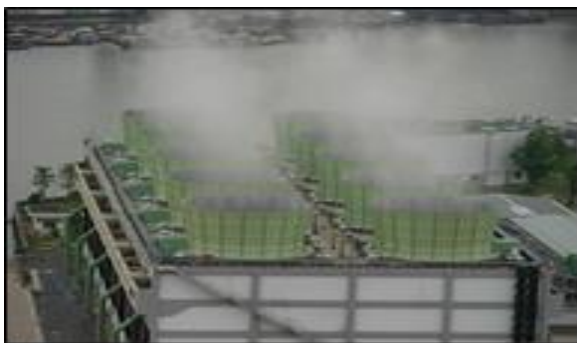
รูปที่ ค-5 การติดตั้งอุปกรณ์ครอบมอเตอร์ขับใบพัด (Cooling Fan Motor) และเพิ่มโครงสร้างเพื่อยึดปล่องใบพัด (Fan Stack) เพื่อลดเสียงที่เกิดจากหอหล่อเย็น