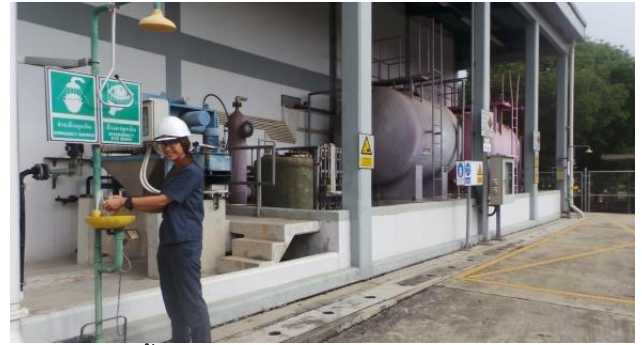
รูปที่ ค-12 การติดตั้งอุปกรณ์ชำระล้างฉุกเฉินบริเวณที่ต้องทำงานสัมผัสกับสารเคมี