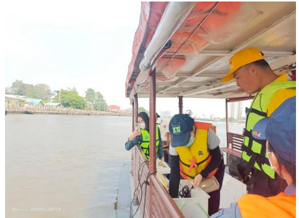
การตรวจวัดคุณภาพน้ำผิวดิน (เมื่อวันที่ 24 มกราคม 2567)