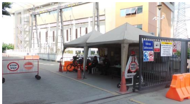
รูปที่ ค-18 การรักษาความปลอดภัยของโรงไฟฟ้าพระนครเหนือ