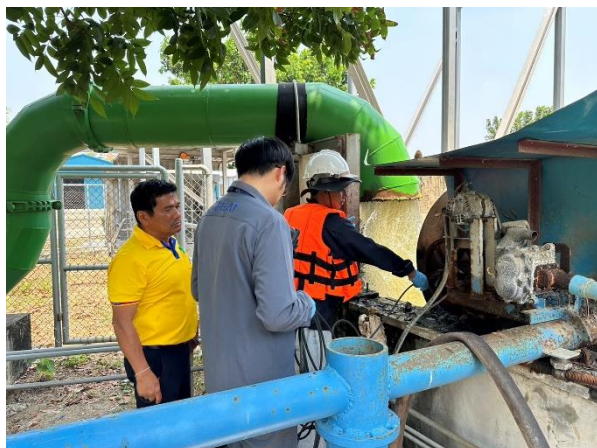
การตรวจวัดการแพร่กระจายอุณหภูมิน้ำหล่อเย็น (เมื่อวันที่ 22 เมษายน 2567)