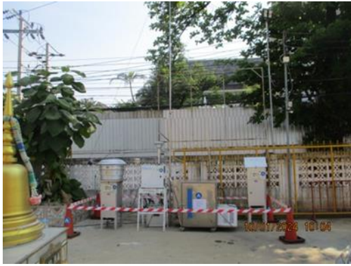
โรงเรียนวัดเชิงกระบือ