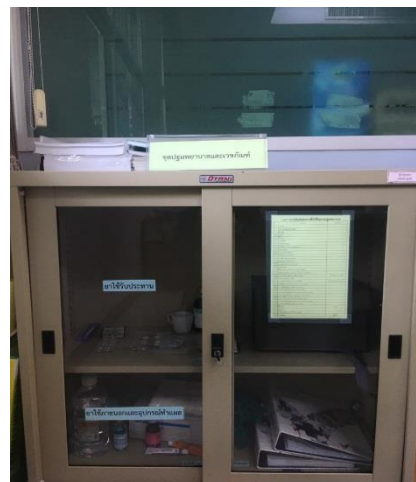
รูปที่ ค-17 อุปกรณ์ปฐมพยาบาลเบื้องต้นบริเวณโรงไฟฟ้า