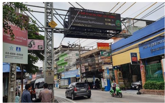
รูปที่ ค-2 จอแสดงผลการตรวจวัดคุณภาพอากาศจากปล่องโรงไฟฟ้า บริเวณทางเข้าโรงไฟฟ้าฯ ด้านถนนเจริญสินทวงศ์ และริมถนนบางกรวย-ไทรน้อย จ.นนทบุรี