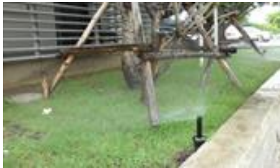
รูปที่ ค-9 การนำน้ำทิ้งที่ผ่านการบำบัดแล้วมาใช้รดน้ำต้นไม้ (ระบบสปริงเกอร์)